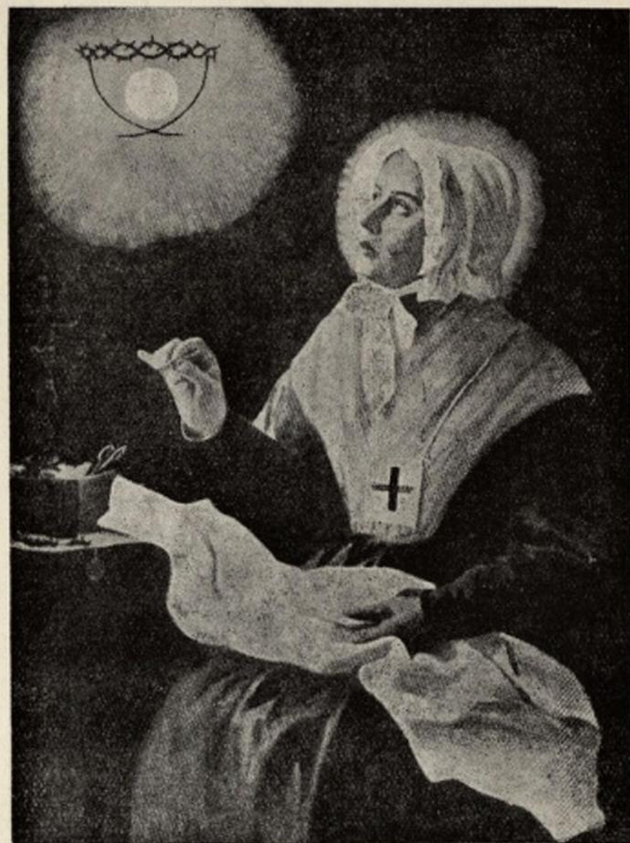
Blahoslavená Anna Marie Taigi