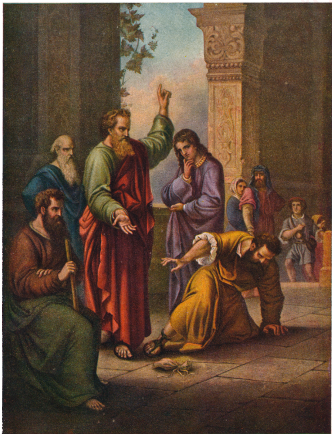
Ananiáš a Safira.