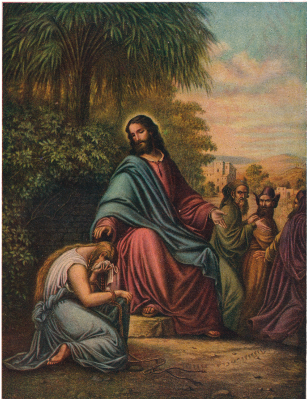
Kristus a žena cudzoložná.