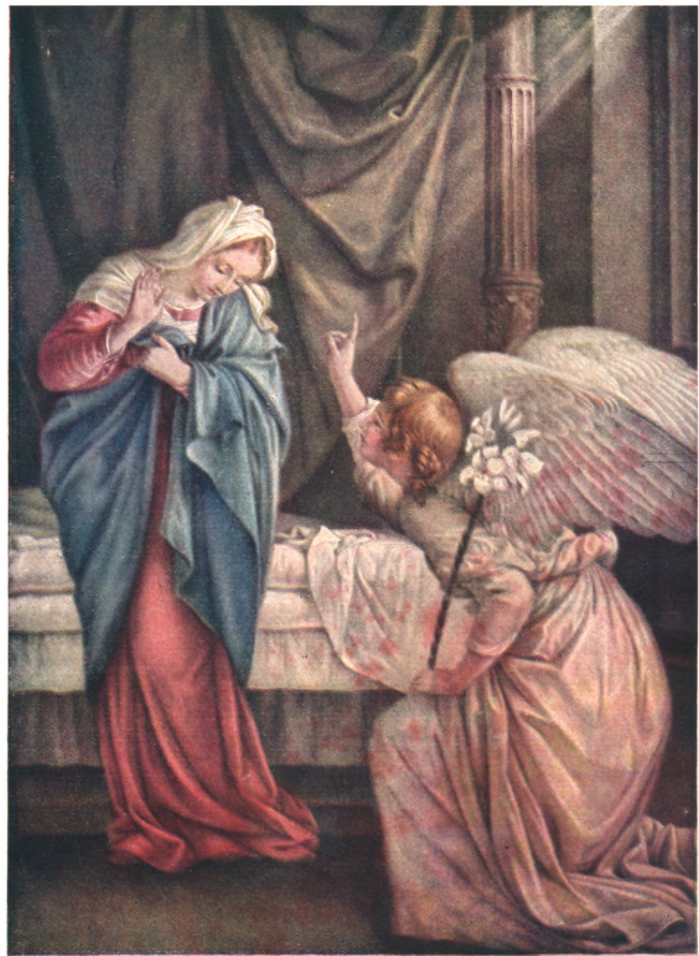
Zvestovanie Panne Marii.