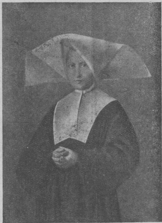
Sv. Katarína Labouré, posolkyňa Panny Márie Zázračnej medaily.