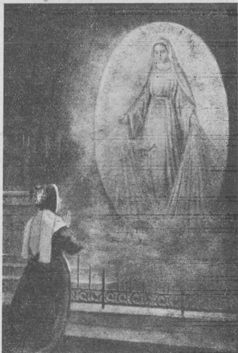
Dňa 27. novembra 1830 vidí sv. Katarína prvú stranu Zázračnej medaily.