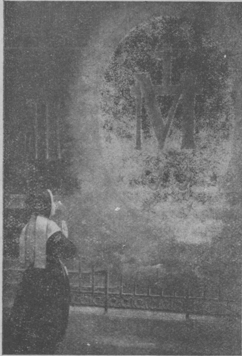
Druhá strana Zázračnej medaily pri zjavení 27. novembra 1830.