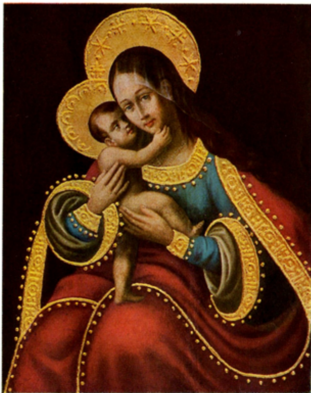
Panna Maria Tasovská