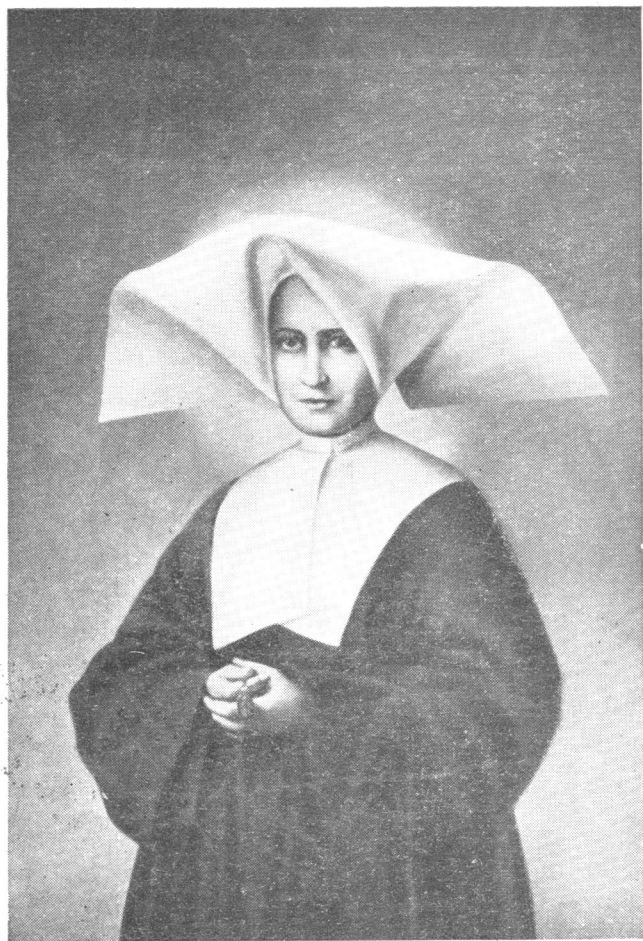
Sv. Katarína Labouré