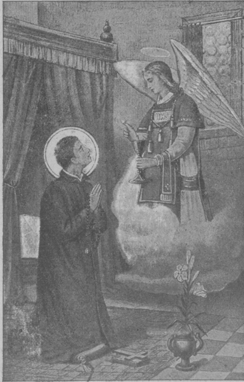
Sv. Stanislav z anjelských rúk prijíma prev. Sviatosť.