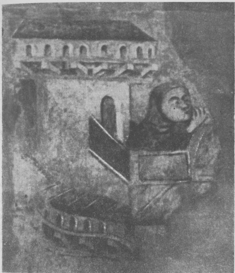
Obraz pôvodného zuborského kláštora, založeného kráľom Svätoplukom. Kláštor je opevnený, v popredí s benediktínom, konajúcim hlásnu službu. Freska z XIII. storočia v kostole v Horných Krškanoch pri Nitre, objavená r. 1938.

cessibilem hominibus silvam ope et auxilio eius (Zuatopulchi) aedificaverunt ecclesiam — na svahu vrchu Zuber traja pustovníci vo veľkej a neprístupnej hore postavili kostol oboťou a pomocou Svätoplukovou — zaznačil Kosmas, český kronikár.